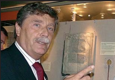
Der OB vor den berühmten, geschichtsträchtigen und für Köln so überaus bedeutsamen Kaiserbullen, links die von Kaiser Friedrich III. vom 19. September 1475, mit der er Köln zur Freien Reichsstadt erhebt, und rechts die Goldbulle aus dem Mai 1235, mit der Kaiser Friedrich II. die Privilegien der Stadt bestätigt, und die gesondert von der Urkunde besonders gesichert aufbewahrt wurde.