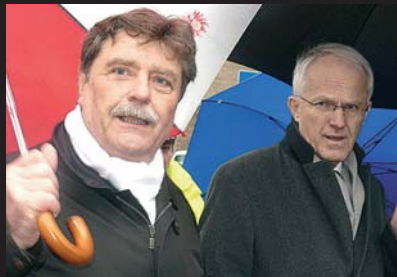
OB Fritz Schramma mit Ministerpräsident Rüttgers bei der Besichtigung der Unglücksstelle